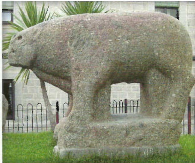
Verraco de Castillo de Bayuela

Constituye una serie de pueblos donde se ofrece una diversidad paisajística, histórica, etnográfica y gastronómica que lo hace ser una comarca muy rica. En Castillo de Bayuela se encuentra el “rey de los rollos” de la provincia de Toledo que se erige en su plaza, así como el retablo de su iglesia obra del ceramista Ruiz de Luna, su portada principal fue realizada por Pedro de Tolosa. En la plaza de San Antonio se pueden ver 3 verracos, testigos del pueblo vetón en estas tierras. De obligada visita es el Centro de Interpretación de la Naturaleza y Patrimonio Histórico de la Sierra de San Vicente .