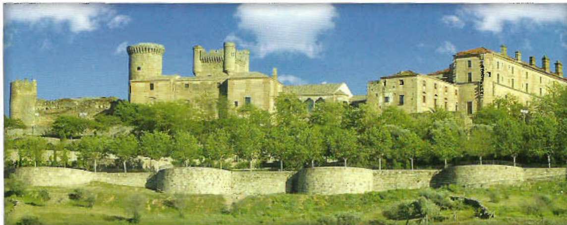
Castillo de Oropesa

Es una de las zonas más ricas de España cinegéticamente, existiendo grandes cotos tanto de caza mayor como menor. La flora es esteparia, predominando el olivo, el alcornoque, la sabina y los pinares. También el monte bajo y los jarales que dan el nombre a esta comarca. Sus terrenos accidentados, con sierras boscosas y rañas esteparias, son cruzadas por la Vía Verde de la